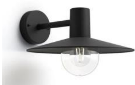
Armatuur naar voordeur